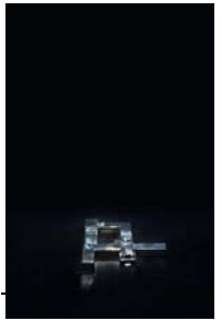
Villa Marista Escultura de plata Silver sculpture 0.5 x 12 x 9 cm. Cortesía del Artista, Galería Elba Benítez (Madrid) y Galería Continua (San Gimignano/Beijing/Les Moulins) - Fotografía: Ela Bialkowska