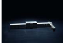
Stasi Escultura de plata Silver sculpture 2 x 7 x 19 cm.