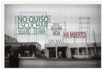
De la Serie La Palabra Transformada (V), 2009.