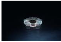
Pentagon Escultura de plata Silver sculpture 1.5 x 9 x 9 cm. Cortesía del Artista, Galería Elba Benítez (Madrid) y Galería Continua (San Gimignano/Beijing/Les Moulins) - Fotografía: Ela Bialkowska