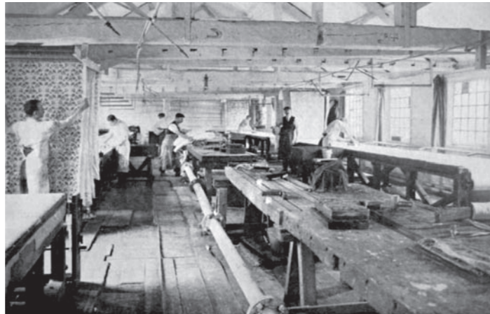
Taller estampación de Morris | Co.. circa 1920

Se ha involucrado en los últimos años en las disciplinas del teatro y la acción como vehículos legítimos para la práctica artística. En sus piezas hacen presencia además otros soportes como la escultura o el objeto, pero también el documento o la fotografía, de forma que se genera un espacio intersticial activado por una narración dramatizada y por la transmisión energética/performativa de objetos y registros documentales. Prospectus , pone en escena la dimensión política del escritor, artista, diseñador y reformador social William Morris, cuya influencia fue decisiva en el contexto británico de la segunda mitad del siglo XIX. Este proyecto, como otros realizados anteriormente por el artista, se sostiene en la idea de la reescritura de la historia y de su utilidad para reflexionar críticamente sobre el presente.