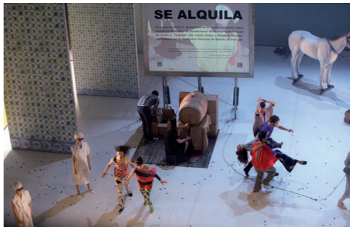
Miedo escénico, Teatro Camões, Lisboa, 2012