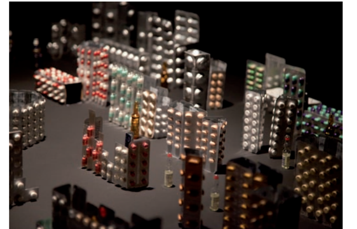
Say Yes! en el ciclo expositivo The Box , Maribel López Gallery, Berlin

Se adentra en la historia de las instituciones psiquiátricas del estado español y repasa minuciosamente tanto la literatura científica como las diferentes representaciones artísticas de la imagen de la locura, para producir un corpus de trabajo –antes político que terapéutico– sobre una comunidad tradicionalmente marginada en el seno de las sociedades poscapitalistas. Un mundo basado en la evidencia , es la maqueta de una ciudad construida con las carcasas vacías de los fármacos psico-activos consumidos por personas con psicosis. La pieza es diseñada por los propios usuarios de dichos fármacos, que adquieren consciencia plena de su ingesta y efectos por el simple hecho de manipularlos con una finalidad en absoluto terapéutica. Es evidente la crítica que se desprende de esta acción lúdica, sobre las implicaciones de la industria farmacéutica y sus intereses económicos para perpetuar el consumo de fármacos.