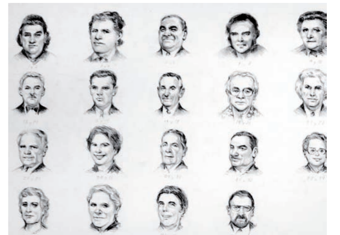
Aires de familia. Lápiz sobre papel, 66 x 101 cm