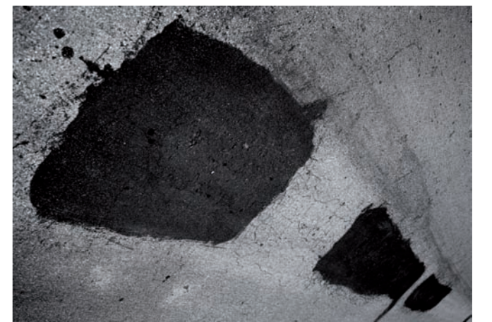
Untitled. Injekt print en papel de algodón, 2012

Explora con su trabajo las tradiciones culturales desde una perspectiva horizontal e íntima tanto con grupos y comunidades como con situaciones sociales e históricas precisas. A partir del video, la fotografía o la escultura, el artista produce imágenes fuertemente simbólicas y habitualmente reconocibles que, lejos de representar visiones idealistas, constituyen poderosos registros interrogativos sobre las realidades culturales en las que se sumerge. Su proyecto Sulcán funciona como un relato dentro de otro relato y a su vez dentro de otros posibles. Las características de un proyecto emocional de esta naturaleza no se cierran con unos objetivos iniciales sino que abre nuevas perspectivas en el curso de su desarrollo. Zink Yi va a utilizar la fotografía como un diario de impactos sensibles a partir del escenario que le acoge y de su conocimiento sobre los vaivenes sociales y políticos que siguen dejando una huella indeleble en el territorio.