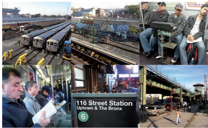
canal*PLURAL. Un grupo de inmigrantes utiliza teléfonos móviles para dar a conocer, mediante crónicas audiovisuales, sus experiencias, opiniones y expectativas en www.megafone.net , Nueva York 2011-2012