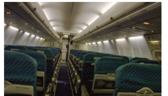
“ ” 1 126 pulsaciones en blanco, tantos como asientos vacíos

Genera a partir de “ ” un proceso de largo recorrido que tiene su origen en otras piezas similares ( Booked y Booked, The Movie ). El denominador común de estos trabajos aparentemente idénticos (solo cambian los escenarios en los que el artista actúa bajo la misma estrategia: adquirir la totalidad de las entradas de un pase de cine, los asientos de un autobús en el trayecto Bilbao-Madrid y el flete completo de un vuelo low cost de España a Túnez) ha de medirse estrictamente en los términos más básicos de consumo al margen de los réditos que tales operaciones generen. En realidad constatan el funcionamiento de un sistema incompleto: el beneficiario desaparece sin que ello altere los servicios ofrecidos. Dicho de otro modo, una película y dos viajes menos y apenas dos centenares de usuarios perplejos.