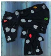
JANNIS KOUNELLIS (El Pireo, Grecia, 1936)