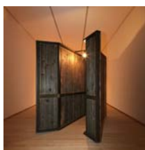
MIROSLAW BALKA (Varsovia, 1958)

Un uso diferente de la imagen requerirá una solicitud por escrito.