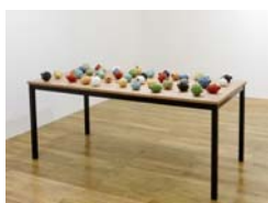
MONA HATOUM (Beirut, 1952)