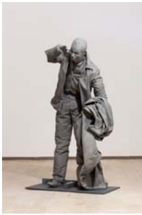
JUAN MUÑOZ (Madrid, 1953 - Ibiza, 2001) Sin título, 2000 Resina de poliéster pigmentada y fibra de vidrio 130 x 65 x 50 cm