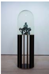
THOMAS SCHÜTTE (Oldenburg, Alemania, 1954) War Memorial, 2003 Bronce, madera, cristal y plástico 211 x 63 x 63 cm