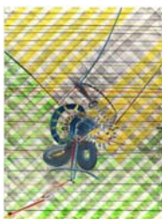
JUAN USILÉ (Santander, 1954) Fagocimanthis, 2010 Vinilo, dispersión y pigmento seco sobre óleo 274,3 x 203,2 cm