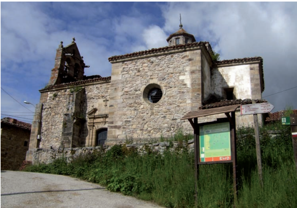
Aspecto de la iglesia antes de su restauración y después de la misma (en cubierta)