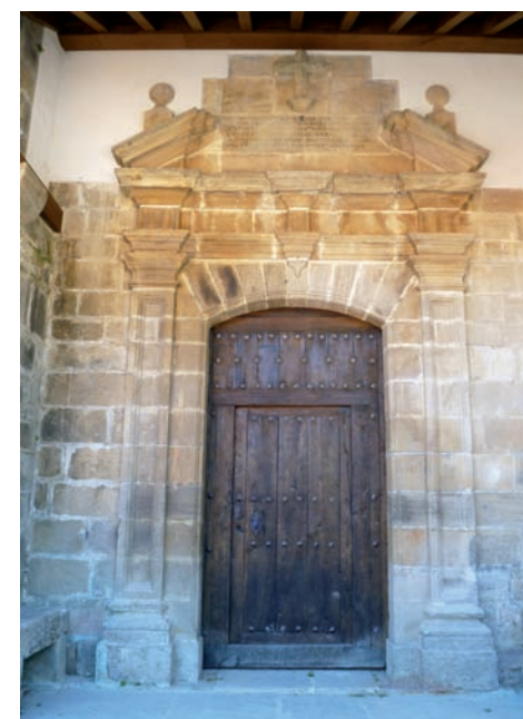
Aspecto de la puerta de la iglesia tras la restauración