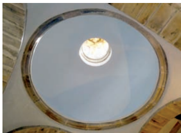
Grietas en las bóvedas (Arriba) Apeo de la cúpula (Centro) Aspecto de la cúpula tras los trabajos de restauración (Abajo)