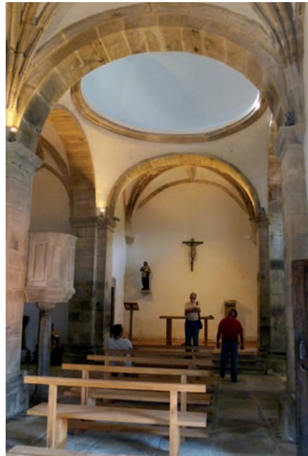
Nave, cúpula y altar