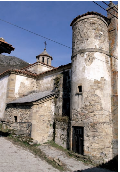
Lado Oeste y subida al campanil antes y después de la restauración