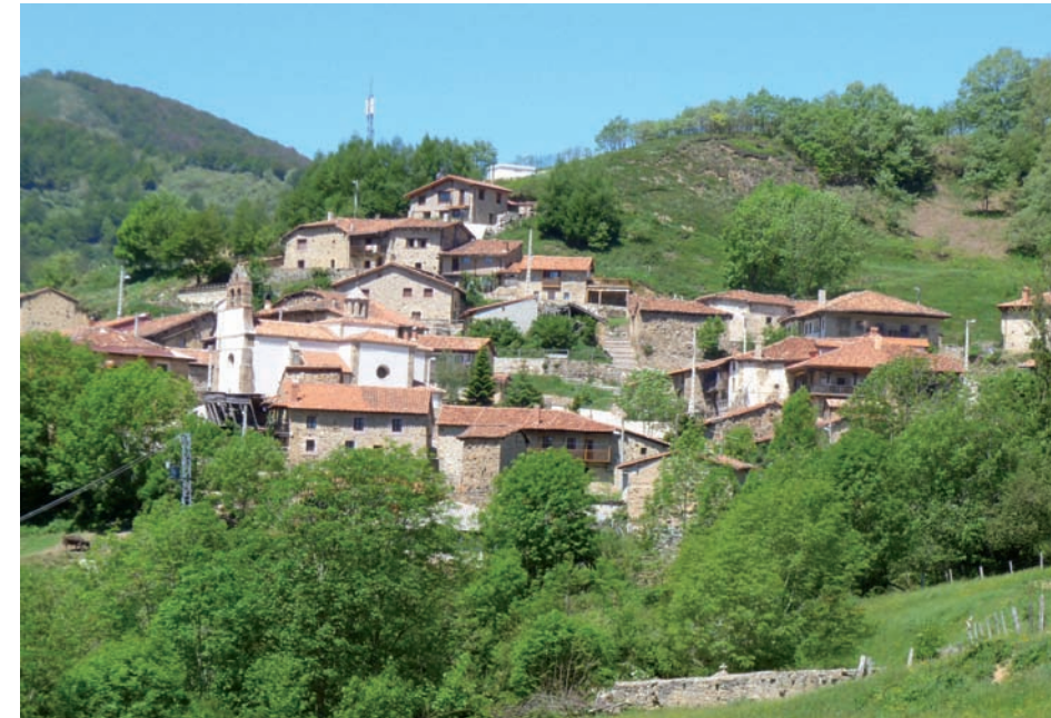
Vista general del núcleo de San Mamés de Polaciones