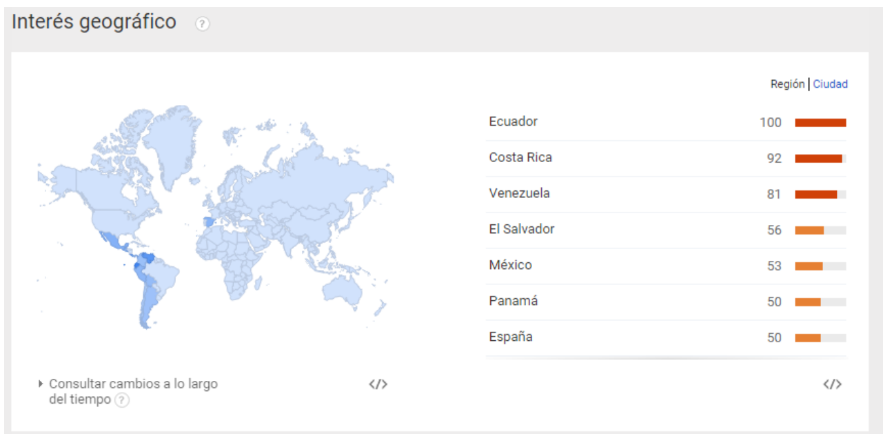
Ilustración 2: Interés geográfico de las palabras discapacidad intelectual e intellectual disability.

En la demanda de información, hay países que realizan mayor número de búsquedas de información de la discapacidad intelectual. Sin embargo, España aparece entre los ocho primeros países del mundo con mayor volumen de búsquedas.