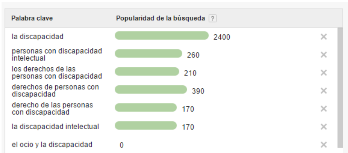
Ilustración 3: Interés de búsqueda en internet de las palabras clave.

comprobado en la Ilustración 3, donde se observa que no existe un volumen relevante de búsquedas referente al ocio y la discapacidad.